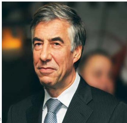
CARL DEVLIES, SECRÉTAIRE D'ÉTAT À LA COORDINATION DE LA LUTTE CONTRE LA FRAUDE

Pas étonnant dès lors que la restitution des fonds vers les pays spoliés reste marginale. Au cours des 15 dernières