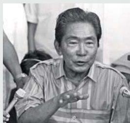
Ferdinand Marcos (en 1985)