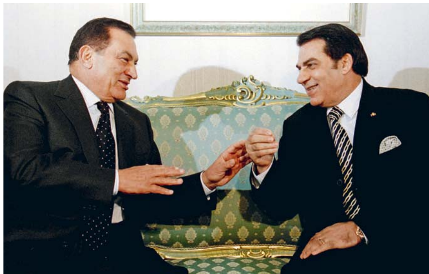
LES EX-DICTATEURS ÉGYPTIEN MOUBARAK ET TUNISIEN BEN ALI Une fortune estimée entre 40 et 70 milliards de dollars pour le premier et à quelque 5 milliards de dollars pour le second.

Le système n'est cependant pas infailible. «La procédure contient de véritables vides juridiques tant au début qu'à la fin du parcours», explique Laure du Castillon, substitut du procureur du Roi de Bruxelles en charge des dossiers tunisien et égyptien. En effet, les mesures de gel décidées au plan national ou régional diffèrent fondamentalement de celles des Nations unies sur le plan juri-